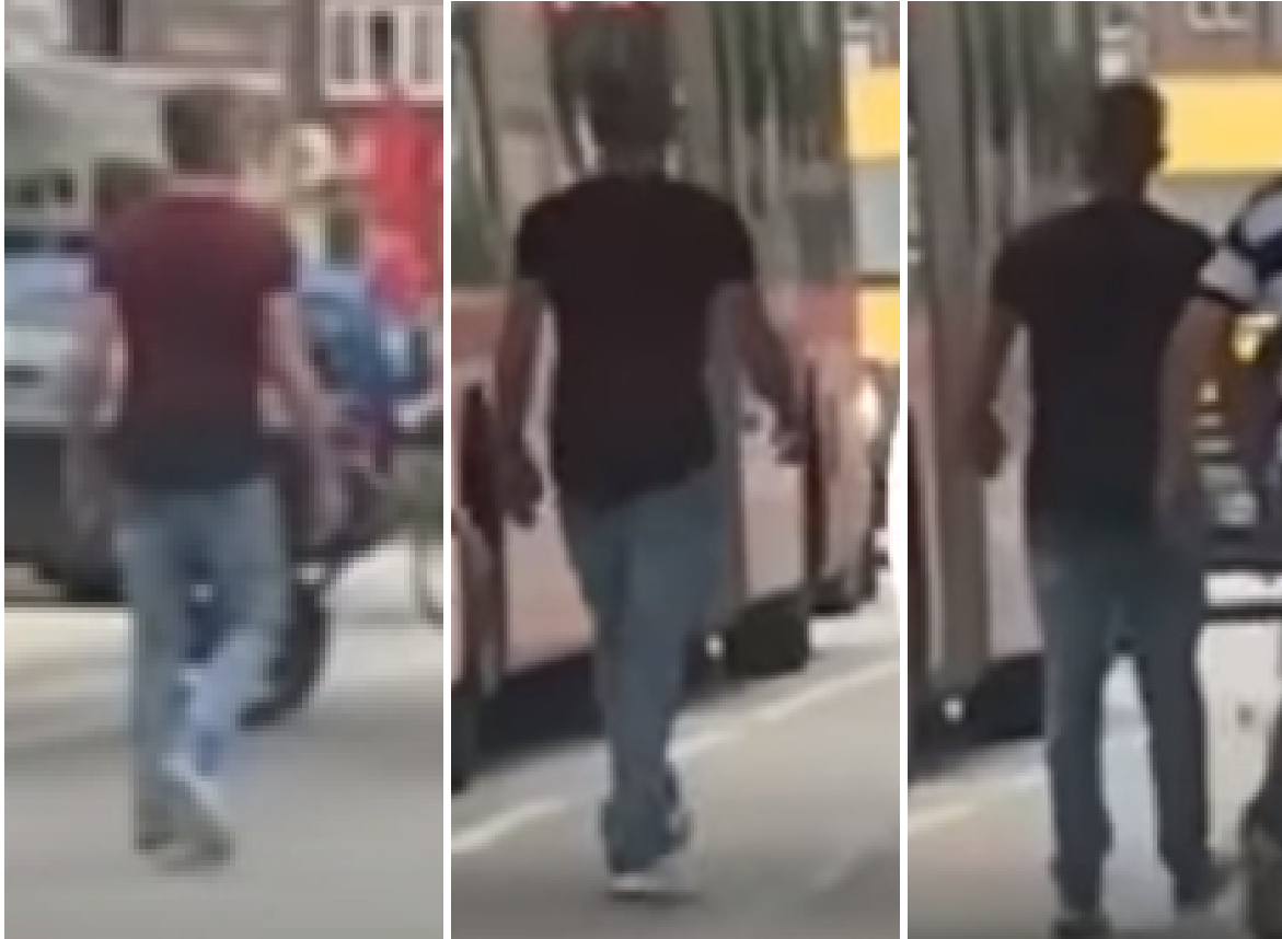
(Ausschnitte aus den oberen beiden Bildern und dem Bild unten)