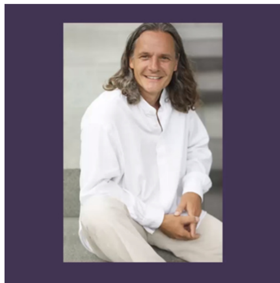
Tagesenergie und Las Vegas Shooting - Podcast vom 08.10.17 14