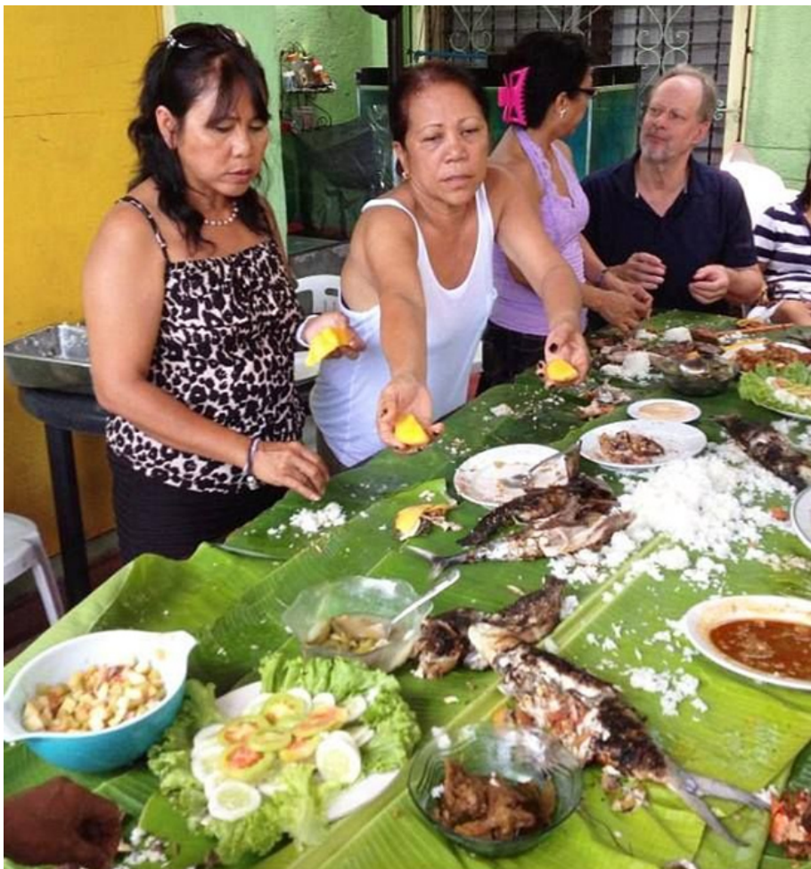
(Stephen Paddock und Marilou Danley auf den Philippinen im Jahr 2013. 11 )