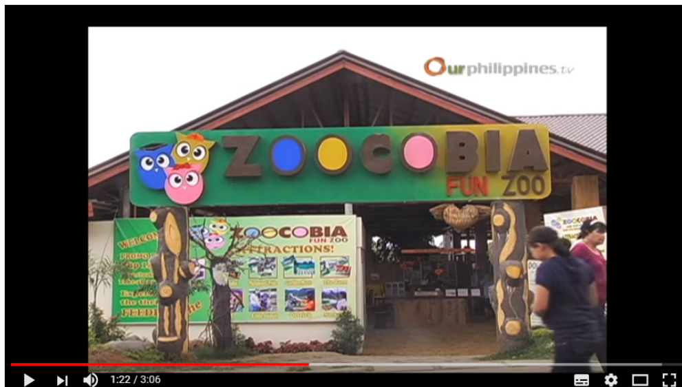
Clark's Paradise Ranch 16

Könnte es möglicherweise eine Verbindung zwischen dieser Paradise Ranch und dem tiefen Staat geben?