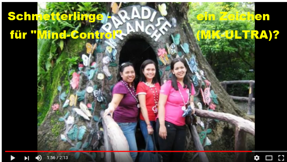
PARADISE RANCH (Philippines) 15

Sie war zum Zeitpunkt der Anschläge praktisch zwei Wochen auf den Philippinen und Paddock hatte ihr 100.000 Dollar auf ihr philippinisches Konto überwiesen. Wofür? Nun, seine Hauptfirma (seit 2004) heißt PARADISE RANCH 21 LLC. 13 Und es gibt erstaunliche Übereinstimmungen mit der "Paradise Ranch" auf den Philippinen: 14