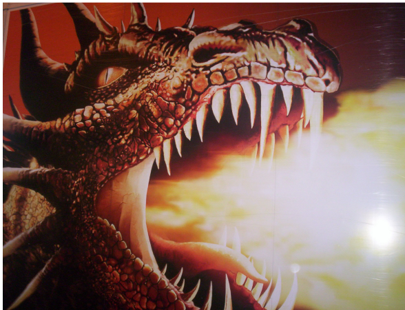
(Sorat-666-Drache auf einem Sixt-LKW)

Es ist offensichtlich, daß die Migrations-Agenda für die Soratmenschen das probate Mittel im 21. Jahrhundert ist, den Arabismus (Islam) in christliche Kulturbereiche hereinbrechen zu lassen, um ... den Menschen auf der Stufe der Tierheit zu halten – natürlich mit Hilfe der anti-christlichen Kirchen-Oberen und unserem Linksstaat. 22 So gesehen ist dies der okkulte Hintergrund der Migrations-Agenda . Diese steht offensichtlich im Zusammenhang mit dem Sorat-1998-Impuls, 23 wo Sorat wiederum aus den Fluten der Evolution am stärksten sein Haupt erheben wird (s.o.).