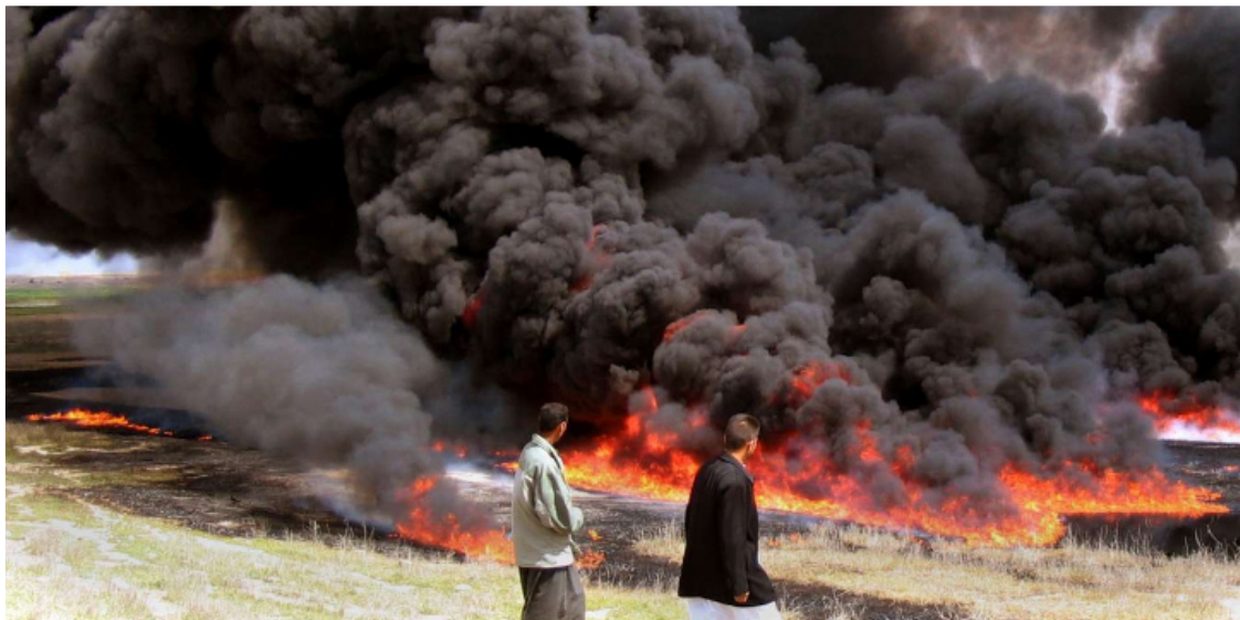
(Die Pipeline wurde von einer Explosion getroffen (Symbolbild). 2 )

In Folge der Explosion zog der Ölpreis deutlich an und kletterte auf mehr als 65 Dollar pro Barrel. Libyen ist Deutschlands drittgrößter Erdöl-Lieferant. Allein die BASF-Tochter Wintershall fördert täglich 65.000 Barrel (je 159 Liter) in Libyen. 1