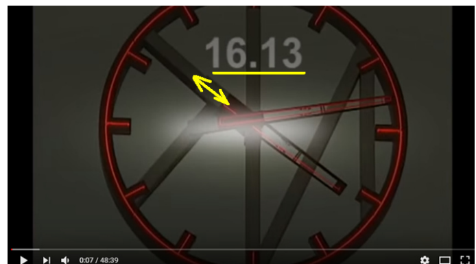
Anna Lindh | Svt Dokumentär 2004

16:13 (Qs = 11) ist die Uhrzeit, wann der Angriff auf Anna Lindh stattfand. 4 Bemerkenswert ist,