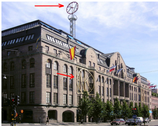
( Nordiska Kompaniet , 3 Eingang Hamngatan, Stockholm)