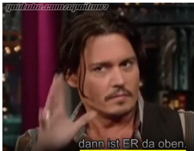
Mind Control: MK ULTRA Part 2/2 13

Schnitt. Vorausgesetzt, Edgar Helmreich hatte tatsächlich Keira Gross am 7. 3. 2018 mit Messerstichen ge-