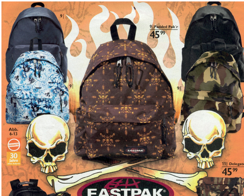
(OTTO-Katalog-Frühjahr-2007-Eastpak. Man sehe sich den Rucksack in der Mitte genauer an ...)