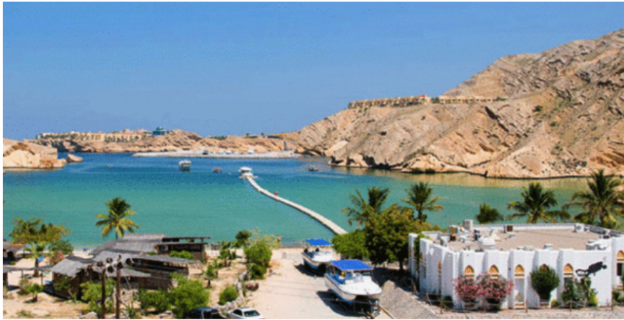
(Muscat Hills Resort, http://timesofoman.com/article/83192 )