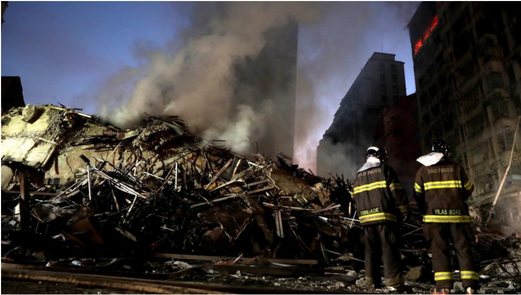
(Feuerwehrlente vor den ausgebrannten Trümmern in Sao Paulo. 8)