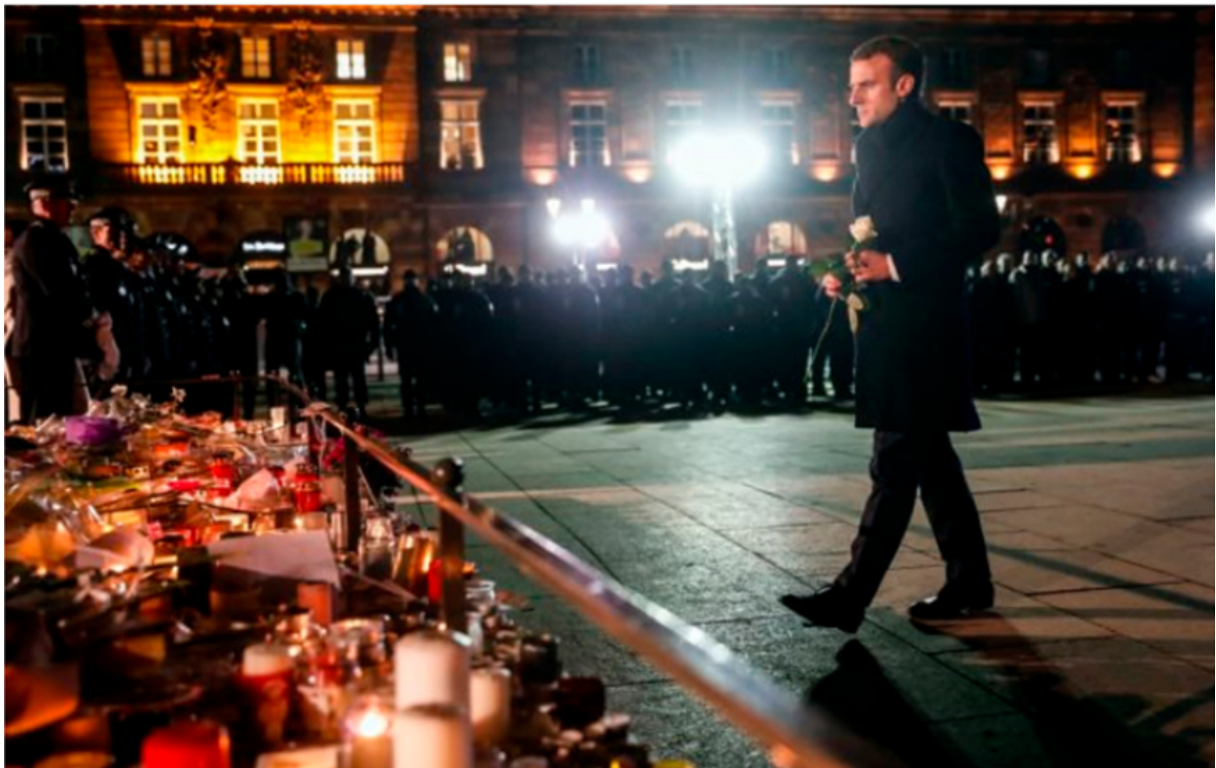
(Präsident Emmanuel Macron in Straßburg, 16. Dezember 2018. 3 )

Es gehört zu den okkulten Verbrechen dazu, daß diejenigen, die davon wissen können (wie Macron, s.u.), sich in Szene setzen: