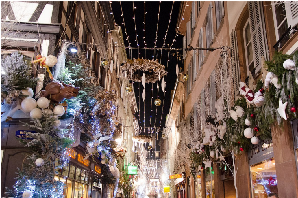
(Rue des Orfevres, wo der Angriff [am 11.12.] begann (im Dezember 2016 abgebildet) 4 )

Warum konnte trotzdem nach (offiziell) einstündigen Terrorangriffen 3 von angeblich einer Person diese von den Sicherheitskräften nicht gestellt werden? (Frage 31)