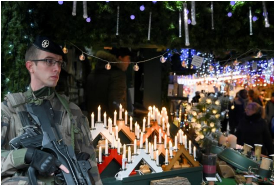
(Wachsamkeit auf dem Straßburger Weihnachtsmarkt, 2018. 5 )

Im Jahr 2016 wurden mehrere Personen in Marseille festgenommen, weil sie für Straßburg einen Terroranschlags vorbereiteten. Beamte erwogen deshalb, den Weihnachtsmarkt nicht stattfinden zu lassen, aber er wurde letztendlich wie geplant abgehalten. 6