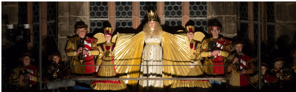
( https://tourismus.nuernberg.de/erleben/christkindlesmarkt/das-christkind/ )