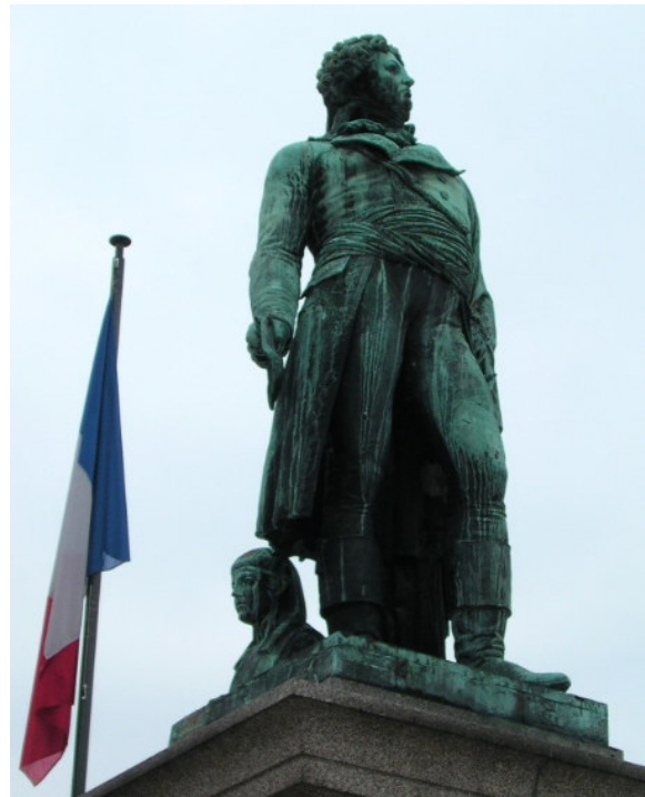
(Klebers Statue auf dem gleichnamigen Platz [in Straßburg], geschaffen von Philipp Graß 4 )

Jean-Baptiste Kléber stammte aus Straßburg, machte Karriere in der von den Illuminaten lancierten französischen Revolution 5 und diente als General in der Revolutionsarmee. Er diente bei der Niederschlagung des Aufstands der Vendée, im ersten Koalitionskrieg gegen Österreich und Preußen und der Expedition Bonapartes nach Ägypten und Syrien. 6