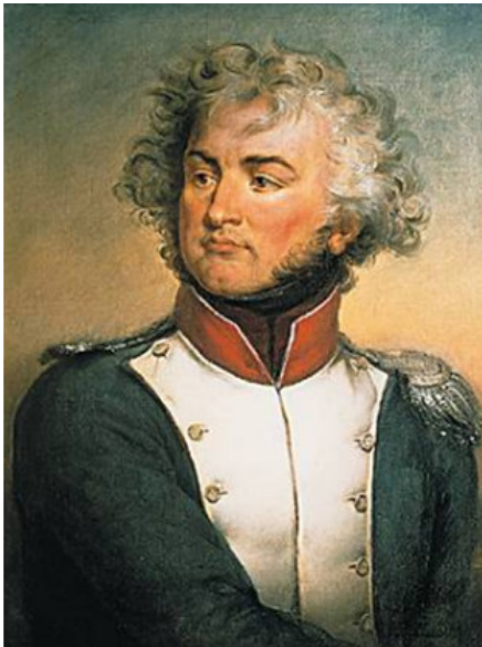
(Jean-Baptiste Kléber, 3 1753-1800)

Der Terroranschlag von Straßburg steht im Zusammenhang mit dem Kleberplatz ( Place Kléber 2 ) – daher ist es wichtig, sich mit dem Monsieur Kléber auseinanderzusetzen.