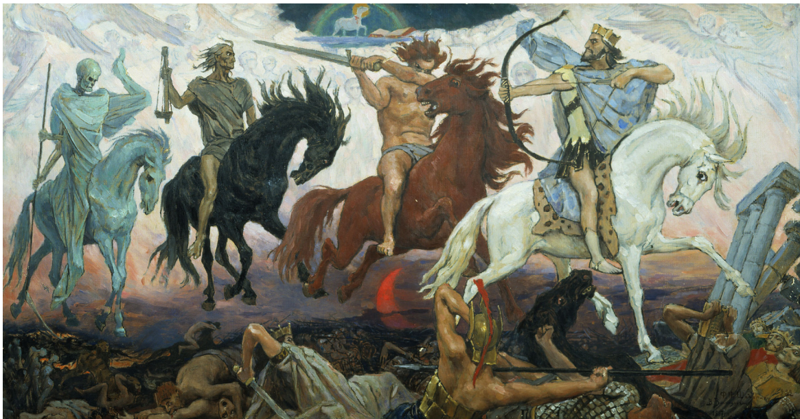
(W. M. Wasnezow: Die vier apokalyptischen Reiter , 1887. 2 Über dem Geschehen steht Christus als Lamm.)