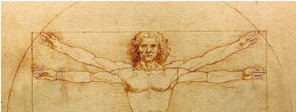
(Leonardos vitruvianischer Mensch , Ausschnitt. Gesamtbild: siehe Artikel 2947, S. 3)

Es hat schon eine Bedeutung, daß Leonardo den vitruvianischen Menschen in Verbindung mit einem Kreis und einem Quadrat zeigt – repräsentiert doch der Kreis den Kosmos und das Quadrat die Erde. Und was macht nun das Logen- Economist -Cover für das Jahr 2019 mit dem