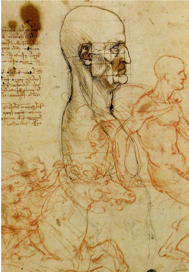
(Männerkopf-Studie 2 )