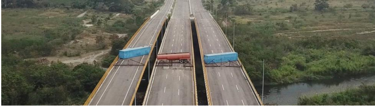
Machtkampf in Venezuela