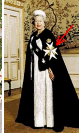
(Malteser-Ritter Elisabeth II. 20 )