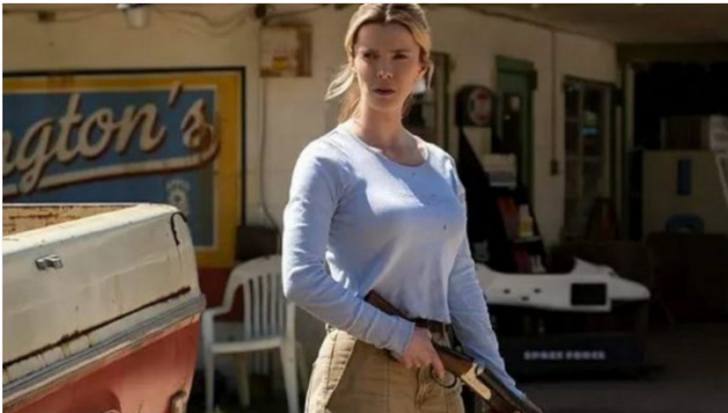
Der Film "The Hunt" von Universal Pictures mit Hauptdarstellerin Betty Gilpin wird nicht veröffentlicht

Der für September geplante Film „The Hunt“, in dem „ Liberale Eliten “ Jagd auf „Deplorables“ machen , wurde bis auf weiteres gestrichen. Dies verlautete Universal Pictures auf in einem offiziellen Statement. Präsident Trump hatte den Film zuvor vorgeworfen „Öl ins Feuer gießen zu wollen und Chaos auszulösen“.