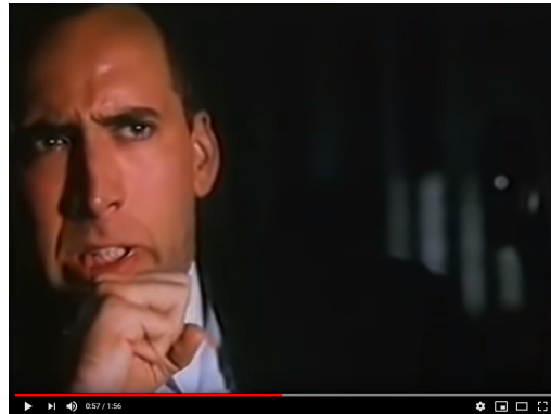
8mm (1999) - Trailer Deutsch 7

Menschen zu jagen scheint hierzulande auch ein Hobby der Antifa zu sein: 8