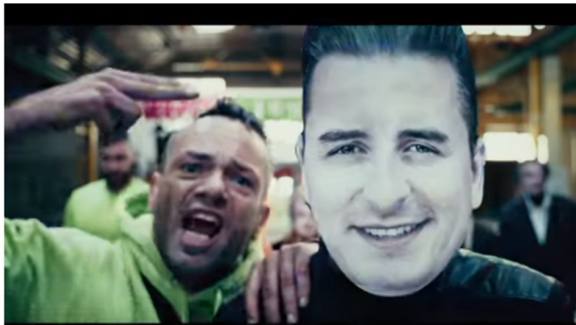
Szene aus dem Video zu "Soviel Polizei" von Kid Pex feat. Kroko Jack

© 11. August 2019 Brennpunkt, Inland 27 Kommentare