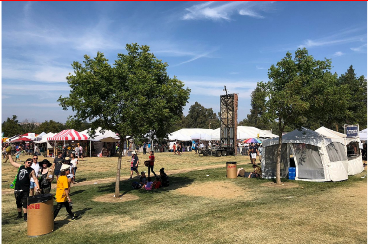
(Gilroy Garlic Festival, 2018 2 )

Wikipedia: 3 Bei einem Attentat auf ein Festival im kalifornischen Gilroy kamen am 28. Juli 2019 vier Menschen (einschließlich dem Attentäter) ums Leben, zwölf weitere wurden verletzt. Das FBI stuft den Fall als Inlandsterrorismus ein.