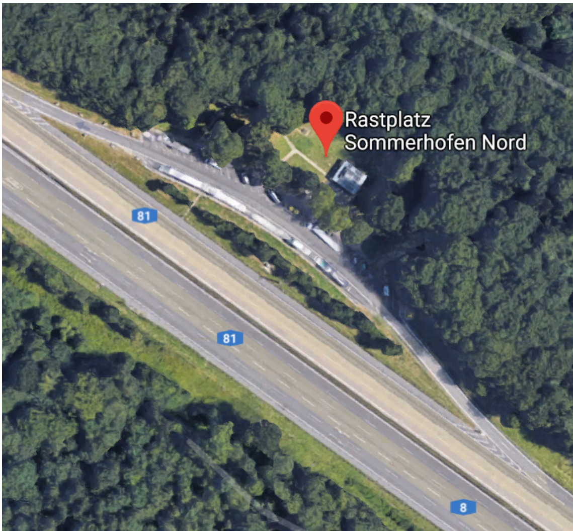
(Der Rastplatz Sommerhofen befindet sich kurz hinter dem Kreuz Stuttgart .)

Suzana Kantorek auf der Autobahn (bei hoher Geschwindigkeit) eingeschlafen sei und "zufällig", sozusagen "im Schlaf" die Ausfahrt zum Rastplatz rechts abgebogen wäre.