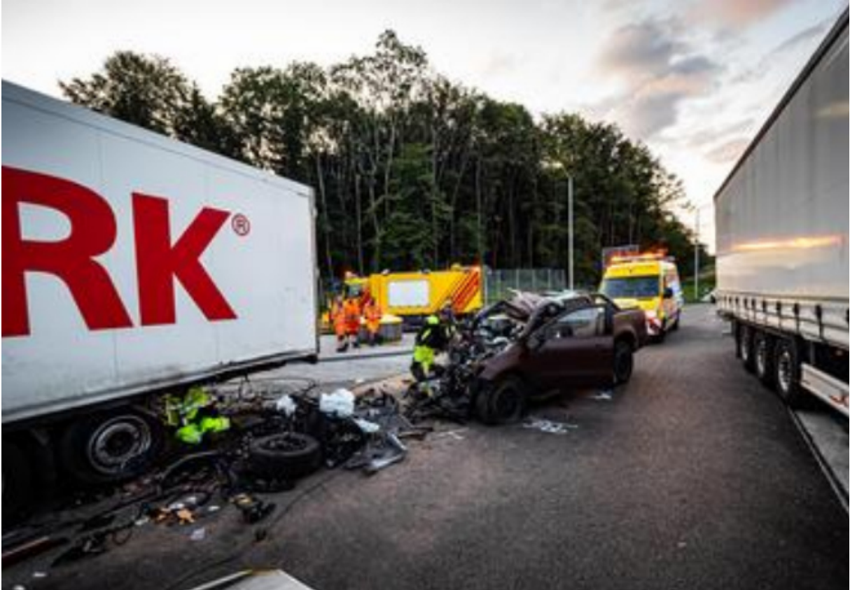
( https://www.heidelberg24.de/region/koeln-50667-star-ingo-kantorek-tot-gaensehaut-post-sorgt-schock-fans-12918402.html )