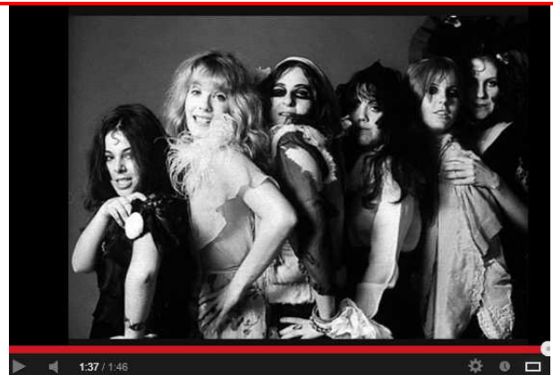
GTO's - The Ghost Chained To The Past, Present And Future 6