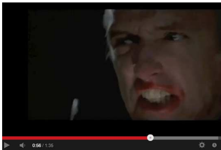
Blue Velvet (1986) trailer