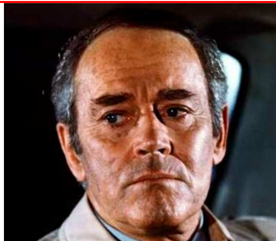
Li: Francis F. Seymour (1908-1950) mit ihrer Tochter Jane Fonda. Seymour ist auch die Mutter von Peter Fonda. Re: Henry Fonda (1905-1982).