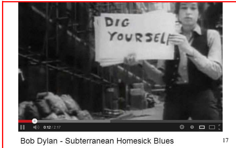
Bob Dylan - Subterranean Homesick Blues