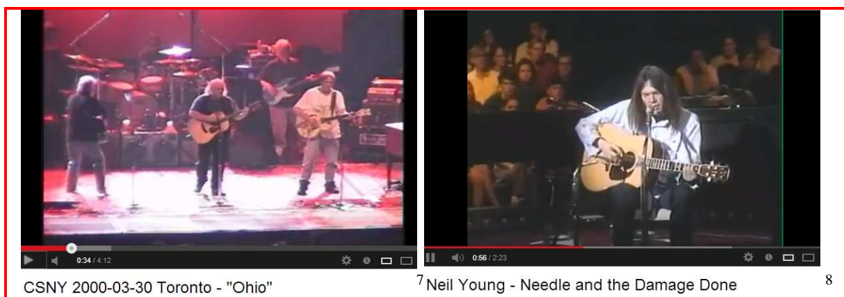
CSNY 2000-03-30 Toronto - "Ohio"

Mir persönlich ging es so mit der Band Crosby, Stills, Nash & Young , die in den 70-er Jahren eine ganze Reihe (meines Erachtens) anspruchsvoller, gesellschaftskritischer Songs wie Ohio 3 (s.u.) oder Needle and the Damage Done 4 (s.u.) veröffentlicht hatten, die aber (u.a.) mit dazu beitrugen, den Folk 5 zu „ver-rocken“ (s.u., li.). Zudem hat man durch die ausführliche geschichtliche Behandlung der wirklichen Musik 6 genügend Vergleichsmaterial.