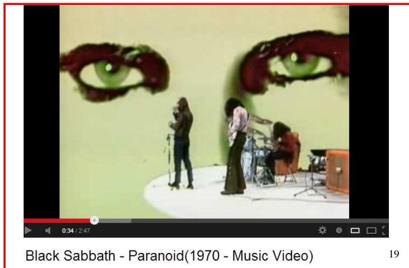
Black Sabbath - Paranoid(1970 - Music Video)

Wir sehen ein ähnliches Phänomen, wenn Black Sabbath davon singt, wie wir den Teufel fürchten und zu Gott um Hilfe schreien. Wie kommt es dann, daß sie nicht eine christliche Gemeinschaft schaffen, sondern den gegenteiligen Effekt bewirken? Es gelingt, weil sie tatsächlich das Publikum in eine Sphäre von Gewalt und Dunkelheit führen , indem sie die Gitarren auf niedrige Vibrationen herunterstimmen, die Lautstärke auf ein Maximum aufdrehen und die hypnotischen Riffs 18 immer und immer wieder wiederholen.