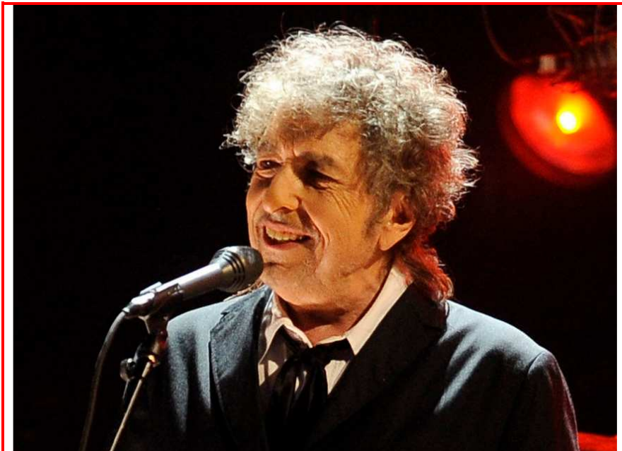
Bob Dylan alias Robert Allen Zimmermann (*1941, USA)

Obwohl die Robert-Johnson-Geschichte ein Mythos sein kann, ist er nicht der einzige, der behauptet, seine Seele für Ruhm und Reichtum an den Teufel verkauft zu haben. Es gibt durchaus ein paar, die dasselbe zugegeben haben – Bob Dylan (s.u.) ist einer von ihnen, wie wir später in diesem Artikel sehen werden.